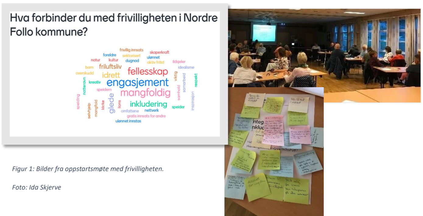
Figur 1: Bilder fra oppstartsmøte med frivilligheten.

Arbeidsgruppa har deltatt aktivt inn i utarbeidelsen av strategien. Gruppa har bestått av representanter fra Røde Kors, Natteravnene, Speideren, Forum for natur og friluftsliv, Follo ms-forening og Bibi Amka/Woman wake up.