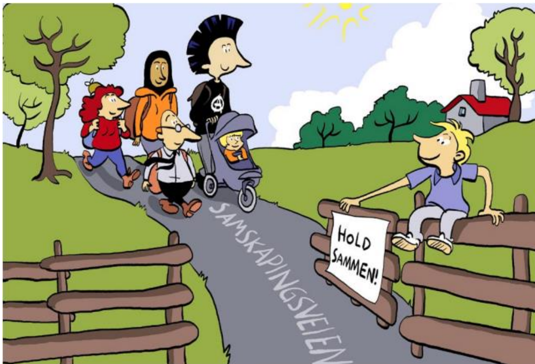
Figur 2: Samskaping illustrert.

Nordre Follo kommune er opptatt av innbyggeren og at kommunens administrasjon har innbyggers fokus når tjenestene skal utvikles. Innbyggeren bør få være sjef i eget liv.